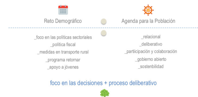
Imagen 1: modelo deliberativo compatible con la eficiencia operativa

Es en este segundo extremo donde la definición de la estrategia hace aflorar la verdadera dimensión del Gobierno Abierto, al aplicar sus postulados, de sobre formulados en un plano teórico, en el contexto de una política pública caracterizada por un alto grado de transversalidad y complejidad. Es en este momento donde la estrategia reorienta su foco al establecimiento de un nuevo modelo de relaciones.