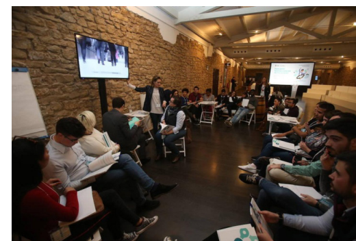
I Foro por la Emancipación de La Rioja en el que se trabajaron algunas iniciativas emblemáticas.