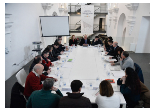
Reunión de la Mesa de Alcaldes en Torrecilla en Cameros.